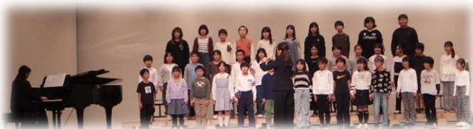
ハーモニーあふれる合唱の1組