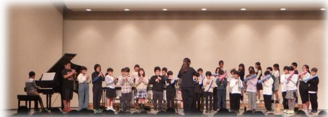
一つになった合奏の2組