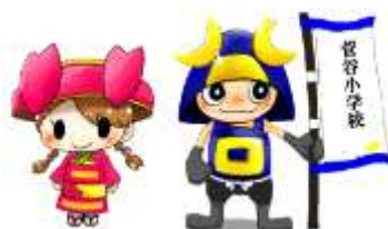
菅美ちゃん 谷丸君 菅谷小学校キャラクター